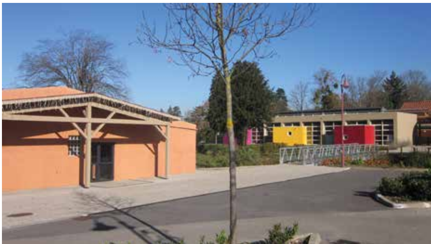
Salle du Pont neuf