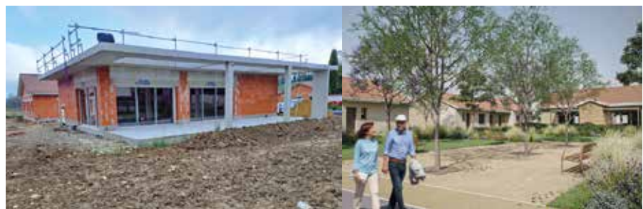
Salle communale en travaux