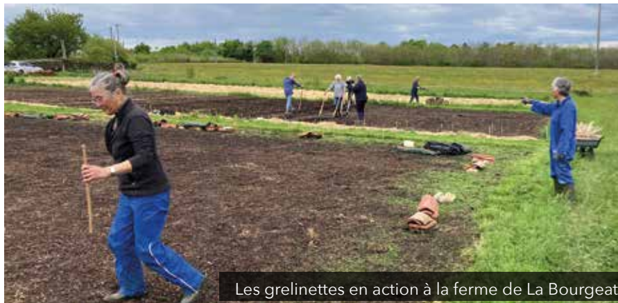
Les grelinettes en action à la ferme de La Bourgeat

En passant par La Bourgeat, vous avez peut-être remarqué l'activité développée les mercredis matin et certains week-end dans les jardins aménagés sur le terrain de l'ancienne ferme Dié, désormais exploitée par l'association virivilloise À 2Mains Au Jardin. Ce projet original, que nous avons déjà évoqué dans ces colonnes, s'appuie sur la participation active de la trentaine d'adhérents aux travaux de maraîchage. Après avoir préparé l'ancienne prairie pour la culture des légumes et petits fruits, ils s'activent dans la bonne humeur pour amender, semer, planter afin de récolter d'ici la fin du printemps et pouvoir proposer les premiers paniers. Plantation d'une haie de 150 m avec l'aide de la Fédération de la chasse de l'Isère, récupération des eaux de pluie,