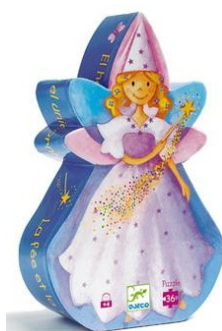
LA FEE ET LA LICORNE 36 pièces

La Ludo compte 218 puzzles dans son fonds de jeux ( dont 45 de la marque DJECO ) ci-dessous les derniers arrivés :