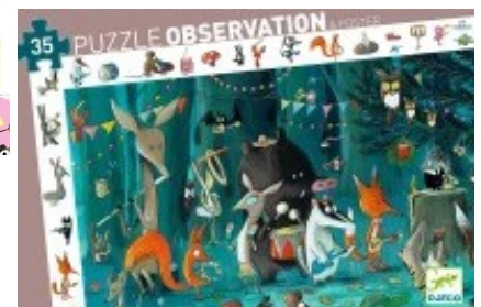
L'ORCHESTRE 35 pièces