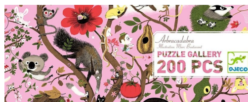
ARBRACADABRA 200 pièces