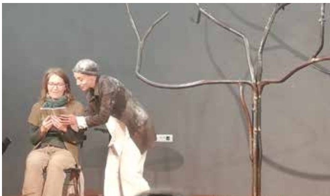
Le spectacle Silencis de Claire Ducreux a constitué le point d'orgue du Festival Souffleurs de mots.

F oire aux livres et aux vinyles, contes pour les tout petits (Un tapis, des histoires ), création de haïku, ces courts poèmes japonais sur la nature et les saisons, Poëmaton, boîte à poèmes, Pâtisserie contée, exposition de dessins des enfants de l'école de la Pérouse... les mots ont été célébrés dans tous les sens au cours de ce premier festival Les Souffleurs de mots qui a été clôturé par le mime ! Le spectacle Silencis de Claire Ducreux, artiste internationale, a ajouté aux émotions créées par les mots, celles d'une gestuelle imagée et poétique jouant avec le public. Le succès de cette première édition a incité les organisateurs, Bouquiniste Chez Jojo, la bibliothèque, le Kafékifé, le Sou des écoles, Bioenvrac et la P'art Bayle à programmer la seconde édition le 1er mai 2023, cette fois en extérieur autour de l'église, si le temps le permet.