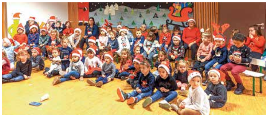
La Chorale de la Maternelle

La musique n'est pas en reste. Avec l'aide de la conseillère pédagogique, une chorale a été créée en maternelle, et elle a présenté ses progrès les 13 et 15 décembre aux parents. Les élèves des cycles 2 et 3 participeront à l'opération Clef des Champs proposée par l'association AIDA (organisatrice notamment du Festival Berlioz). Des musiciens interviendront dans les classes pour préparer un concert mettant en scène les héros Ernest et Célestine : ce sera l'occasion de s'initier à la mise en scène, au chant choral et aux pratiques musicales. Pour accompagner et soutenir ces initiatives musicales, l'école a fait l'acquisition d'un piano électronique. Enfin, les CM1 et CM2 participeront au grand spectacle du couvent des Ursulines qui sera produit en août prochain.