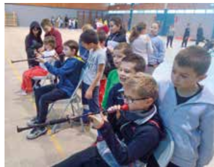
Jeux d'opposition pour les écoliers.

Le sport n'est pas oublié dans les projets. Avec l'Union sportive de l'enseignement du premier degré (USEP), un club sportif sera ouvert aux enfants dès le mois de janvier. Co-animé par les enseignants et les parents, il proposera des jeux collectifs, jeux d'opposition et activités sportives auxquelles tous les élèves, quelles que soient leurs capacités, pourront participer.