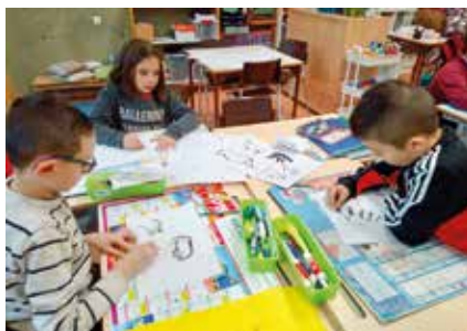
Les écoliers s'initient à l'art pariétal.