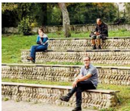
Un théâtre de verdure de ce type équippa bientôt le jardin de l'école.