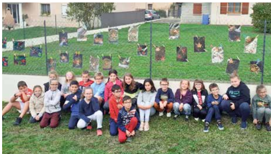
La classe de CE2/CM2 devant l'exposition de ses dessins à la Fête de l'Automne.

L'environnement de l'école est également très important pour que celle-ci soit en mesure de remplir pleinement son rôle. Autour de cette équipe éducative soudée et compétente, se met en place progressivement un groupe