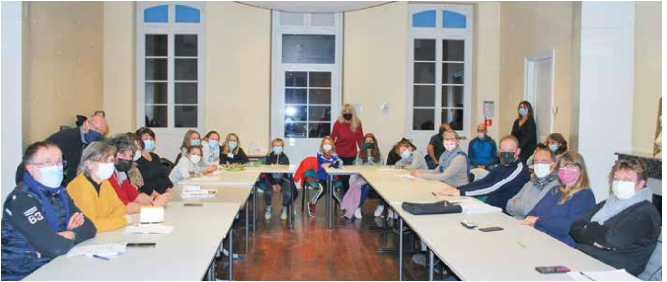
Rencontre entre les conseillers enfants et adultes le 9 décembre.

Tout va bien. Il y a peu nous avons été invités par Bièvre Isère Communauté pour assister à une représentation du festival du cirque à Grenoble. C'était vraiment super !