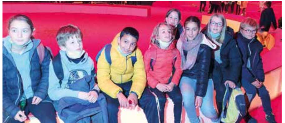
Le conseil municipal des enfants au Festival international du cirque. Une belle soirée !

Plus récemment nous avons commencé à réfléchir sur l'aménagement du city-stade, car nous avons reçu une lettre des délégués de l'école avec une liste de souhaits. Nous aimerions installer des arbres et des bancs pour que le lieu soit plus agréable quand il fait chaud.