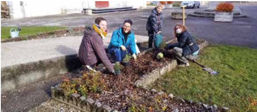
Plantation d'un verger collectif devant la bibliothèque