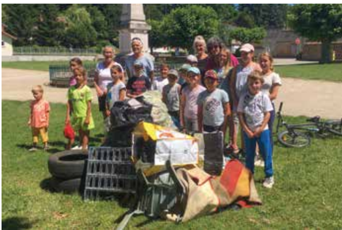
Les participants avec leur "butin".

À l'initiative du Conseil Municipal des Enfants (CME), une chasse aux déchets s'est déroulée à Viriville samedi 26 juin.