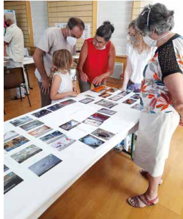
Fresque du climat : mieux comprendre le dérèglement climatique

Parmi les idées à l'étude : cours d'anglais, apprentissage du langage des signes (recherchons quelqu'un qui pourrait transmettre), répare-café... le mardi soir. N'hésitez pas, poussez la porte du Kafé-Kifé ! Ouvert le samedi de 10h à 13h et le mardi de 18h à 20h.