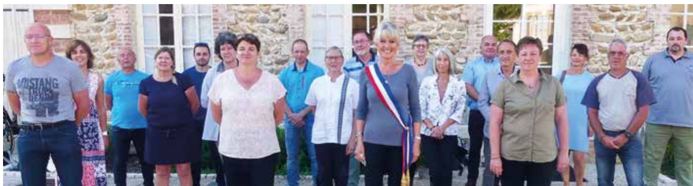
Le conseil municipal au complet