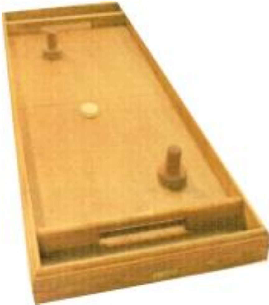
TABLE A GLISSER

122x51 cm 2 poignées 1 palet 1 règle de jeu