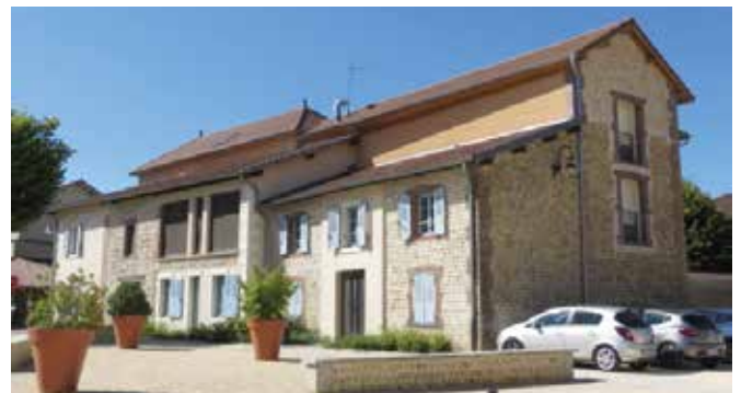
Aménagement d'un cabinet médical avenue du docteur Turc

321 946 €, c'est l'écart entre les recettes et les dépenses de fonctionnement qui constitue l'autofinancement et qui nous permet d'investir sans recourir à l'emprunt.