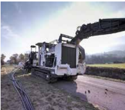
Trancheuse en service pour les fourreaux de fibre optique

En Isère, 2 500 km d'infrastructures sont en cours de construction pour acheminer la fibre optique et se raccorder au réseau national de communications électroniques. Le Département commande la réalisation de cette autoroute optique qui concerne non seulement la pose des fourreaux mais aussi l'édification de 110 locaux techniques hébergeant les équipements actifs dits "nœuds de raccordements optiques" (NRO).