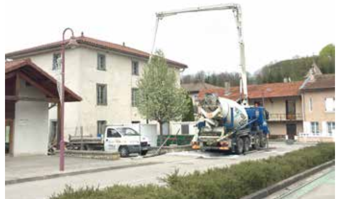
Travaux appartements maison paroissiale