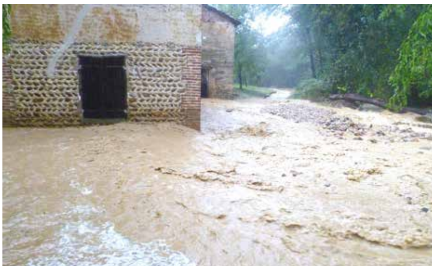
Inondation du 23 octobre 2013 aux Gargognes

Pour une organisation optimale des secours, la commune a mis en place le Plan Communal de Sauvegarde (PCS). Ce document opérationnel prévoit