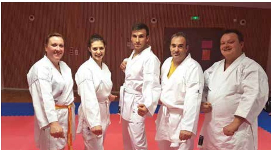
Cinq karatékas du groupe adulte

Le Shotokan Karaté Club de Viriville a démarré sur les chapeaux de roues. Un groupe de sept adultes s'est mis en place le vendredi à 20h30 pour apprendre la self-défense et les enchaînements techniques de kata.