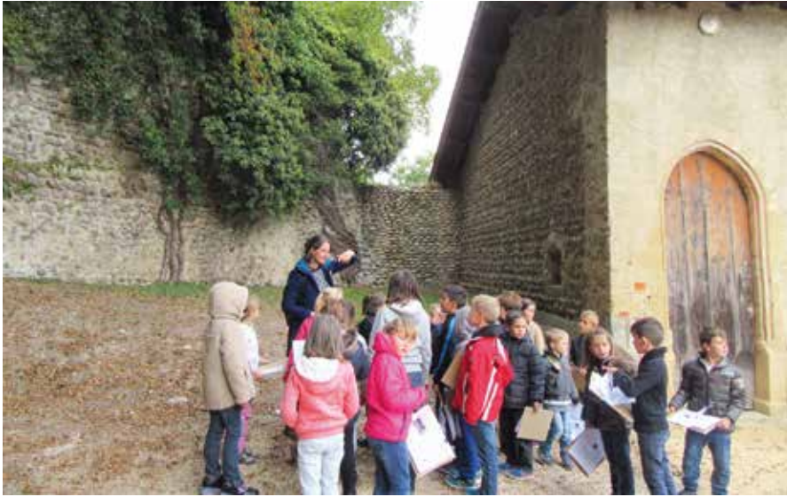
Animation devant la chapelle de Grolée